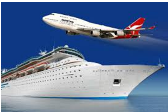
Mezzi di trasporto