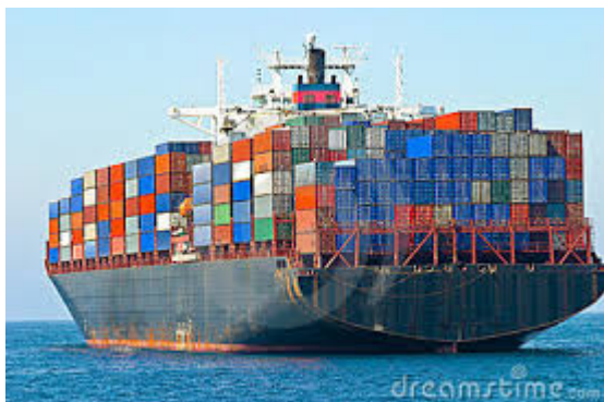
Merci in importazione da Paesi terzi